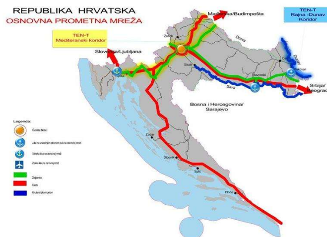
Slika 2. Položaj Grada Križevaca u željezničkom prometu Republike Hrvatske