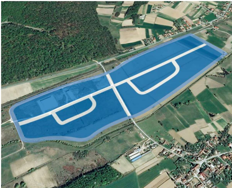
Slika 6. Gospodarska zona Gornji Čret

Poduzetnička zona Gornji Čret određena je prostorom između državne ceste D41 i željezničke pruge M201-((Gyekenyes)-Državna granica-Botovo-Koprivnica-Dugo Selo) sa sjeverne strane i trasom planirane brze ceste DC 10, s južne strane. Postoji mogućnost kolosječnog priključka na industrijski željeznički kolosijek svake pojedine parcele. Na 50% površine zone izgrađena je kompletna infrastruktura – asfaltirana prometnica, elektroopskrba i javna rasvjeta, vodovodna mreža, mreža odvodnje i plinska mreža.