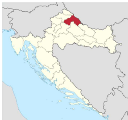
Slika 1. Položaj Koprivničko – križevačke županije u Republici Hrvatskoj

Koprivničko-križevačka županija i Grad Križevci s istočne strane graniči s Republikom Mađarskom i nalazi se na glavnom cestovnom i željezničkom pravcu između Zagreba i Mađarske, a izgrađena brza cesta od Zagreba do Križevaca učinila je grad još bližim i dostupnijim te je sada svega tridesetak minuta udaljen od glavnog grada Zagreba.