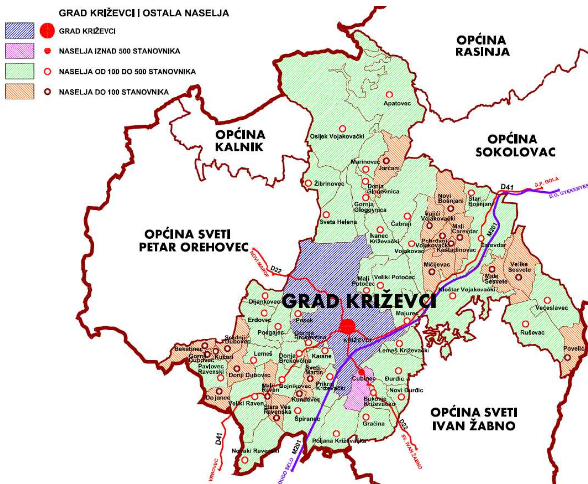
Slika 4. Sustav naselja unutar Grada Križevaca