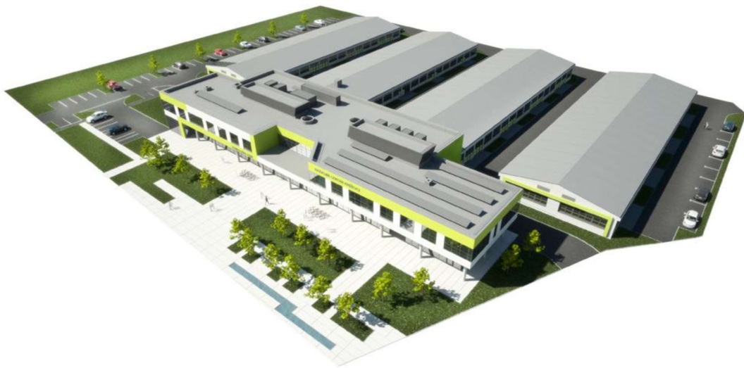
Slika 7. Razvojni centar i tehnološki park Križevci – vizualni prikaz

postojeće tvrtke, s vlastitim priključkom struje, vode, plina, telefona, Interneta, sa sanitarnim čvorom i sl. Podijeljene su u module različitih površina koje mali i srednji poduzetnici koriste pod povoljnim uvjetima. U zgradi E, ukupne površine od 3.175 m 2 predviđen je istraživački laboratorij i zajednički sadržaji za poduzetnike (sobe za sastanke, konferencijska dvorana, uredi uprave, posebni uredi poduzetnika, kafić, izložbeni prostor za nove proizvode i inovacije poduzetnika, recepcija i sl.). U prosincu 2017. godine u prostorima RCTP-a otvoren je i "Choco bar", projekt socijalnog poduzeća Hedona d.o.o. koji je pokrenula Udruga osoba s invaliditetom u Križevcima.