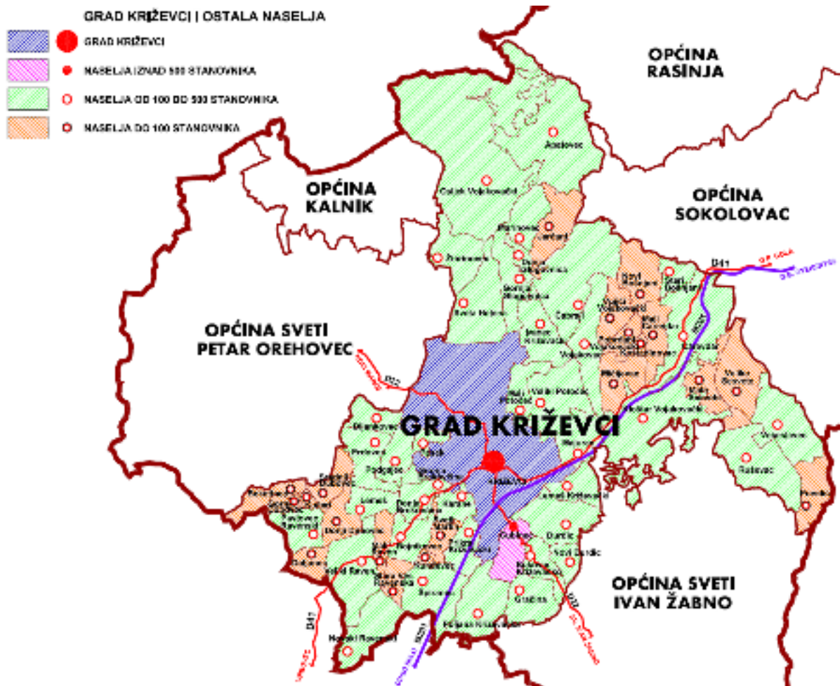
Slika 4. Sustav naselja unutar Grada Križevaca