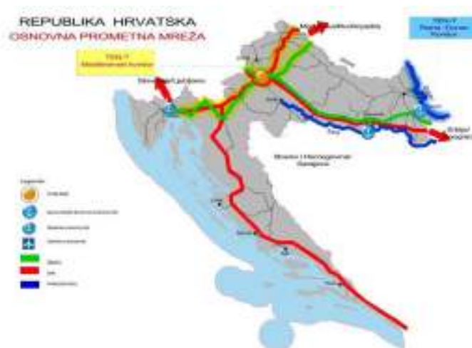
Slika 2. Položaj Grada Križevaca u željezničkom prometu Republike Hrvatske