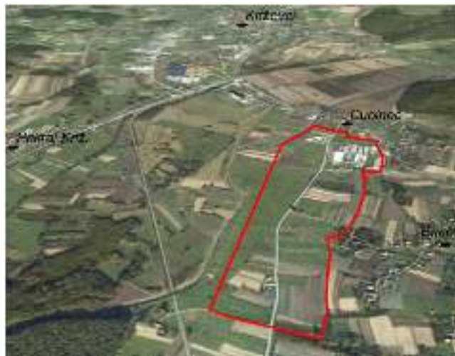
Slika 5. Gospodarska zona Cubinec

Poduzetnička zona Cubinec je prometno optimalno pozicionirana – nalazi se u neposrednoj blizini željezničkog kolodvora i povezana je, osim s državnom cestom D22 (Novi Marof-Križevci-Bjelovar), također i s brzom cestom Gradec-Križevci koja je otvorena za promet u rujnu 2016. godine te je značajno doprinijela kvalitetnoj prometnoj povezanosti Križevaca i Zagreba.