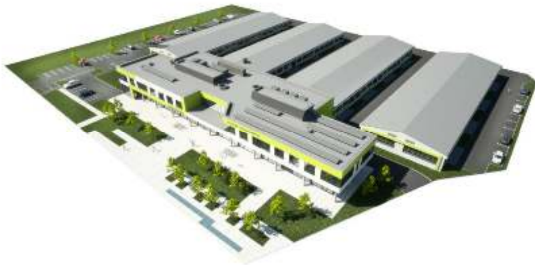
Slika 7. Razvojni centar i tehnološki park Križevci – vizualni prikaz

postojeće tvrtke, s vlastitim priključkom struje, vode, plina, telefona, Interneta, sa sanitarnim čvorom i sl. Podijeljene su u module različitih površina koje mali i srednji poduzetnici koriste pod povoljnim uvjetima. U zgradi E, ukupne površine od 3.175 m 2 predviđen je istraživački laboratorij i zajednički sadržaji za poduzetnike (sobe za sastanke, konferencijska dvorana, uredi uprave, posebni uredi poduzetnika, kafić, izložbeni prostor za nove proizvode i inovacije poduzetnika, recepcija i sl.). U prosincu 2017. godine u prostorima RCTP-a otvoren je i "Choco bar", projekt socijalnog poduzeća Hedona d.o.o. koji je pokrenula Udruga osoba s invaliditetom u Križevcima.