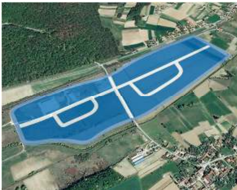
Slika 6. Gospodarska zona Gornji Čret

Poduzetnička zona Gornji Čret određena je prostorom između državne ceste D41 i željezničke pruge M201-((Gyekenyes)-Državna granica-Botovo-Koprivnica-Dugo Selo) sa sjeverne strane i trasom planirane brze ceste DC 10, s južne strane. Postoji mogućnost kolosječnog priključka na industrijski željeznički kolosijek svake pojedine parcele. Na 50% površine zone izgrađena je kompletna infrastruktura – asfaltirana prometnica, elektroopskrba i javna rasvjeta, vodovodna mreža, mreža odvodnje i plinska mreža.