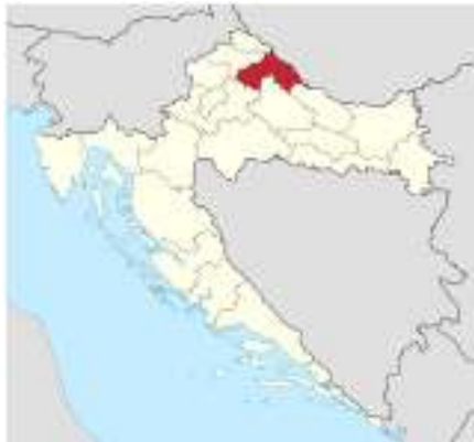
Slika 1. Položaj Koprivničko – križevačke županije u Republici Hrvatskoj

Koprivničko-križevačka županija i Grad Križevci s istočne strane graniči s Republikom Mađarskom i nalazi se na glavnom cestovnom i željezničkom pravcu između Zagreba i Mađarske, a izgrađena brza cesta od Zagreba do Križevaca učinila je grad još bližim i dostupnijim te je sada svega tridesetak minuta udaljen od glavnog grada Zagreba.