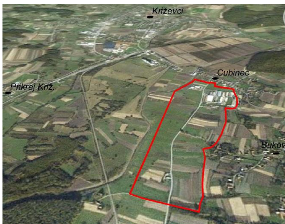
Gospodarska zona Cubinec

Smještena je u istoimenoj ulici, a neposredno se veže na državnu cestu D41 (Vrbovec-Križevci-Koprivnica)-Zagrebačku ulicu te na željeznički kolodvor Križevci i državnu cestu D22 (Novi Marof-Križevci-Bjelovar). Zona je u potpunosti komunalno dovršena. Prostorno-planski dokument koji je posljednji izrađen je usklađenje Urbanističkog plana uređenja gospodarske zone Cubinec (UPU) s Prostornim planom uređenja Grada Križevaca iz 2013. godine. Treba napomenuti i da je 2008. godine po izboru Ministarstva gospodarstva, rada i poduzetništva, križevačka PZ Nikola Tesla bila proglašena najuspješnijom u Republici Hrvatskoj. U zoni danas djeluje 35 poduzetnika raznih profila proizvodnih, uslužnih i trgovačkih djelatnosti. Zona je površine 57,6 ha, od čega Grad na raspolaganju trenutno nudi 0,42 ha slobodnog zemljišta.