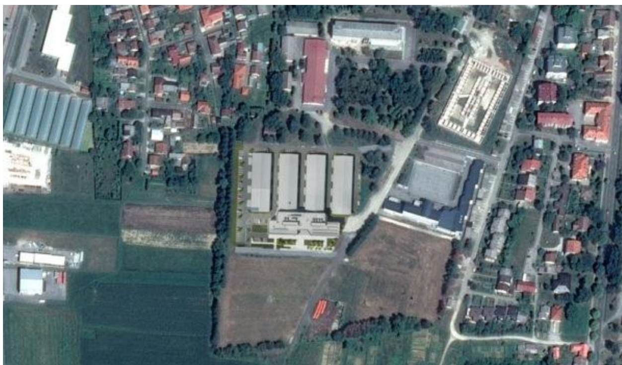
Razvojni centar i tehnološki park Križevci – ortofoto