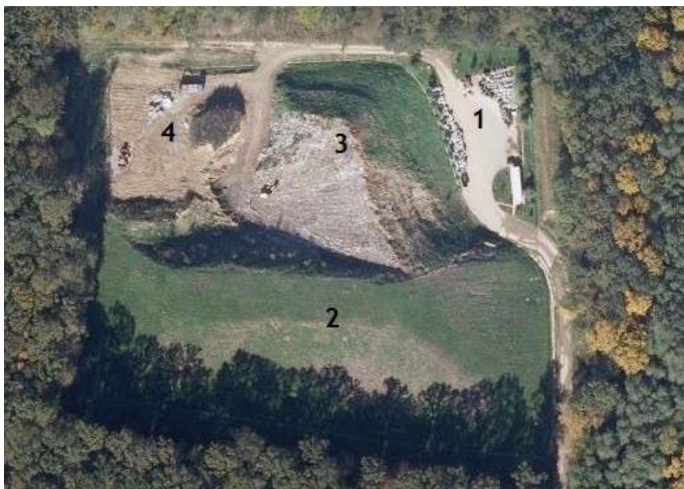
Odlagalište otpada Ivančino brdo

Kako je ukupna količina sakupljenog komunalnog otpada 2017. godine iznosila 5.702,42 t, ukupna količina skupljenog otpada po stanovniku iznosila je 269 kg.