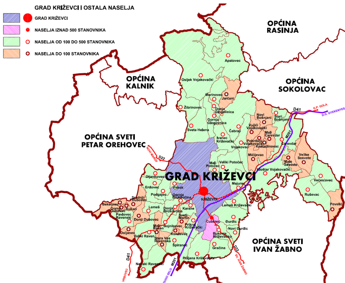
Sustav naselja unutar Grada Križevaca