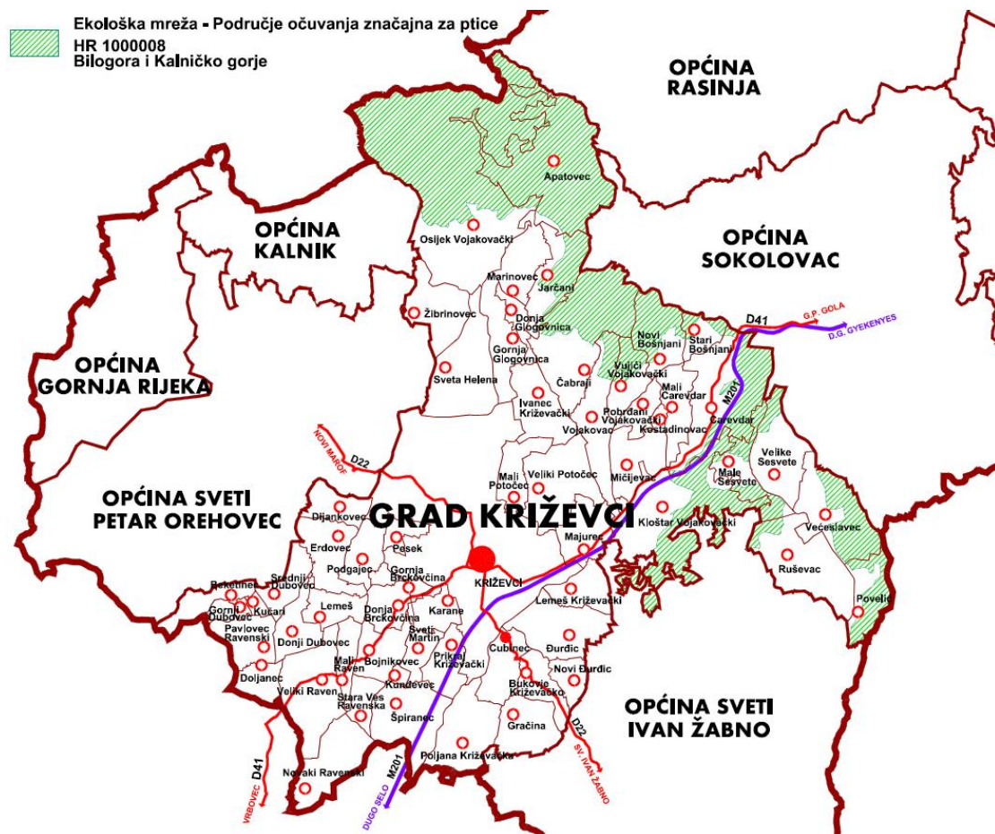
Prikaz 3 Prikaz područja ekološke mreže unutar JLS – Grad Križevci