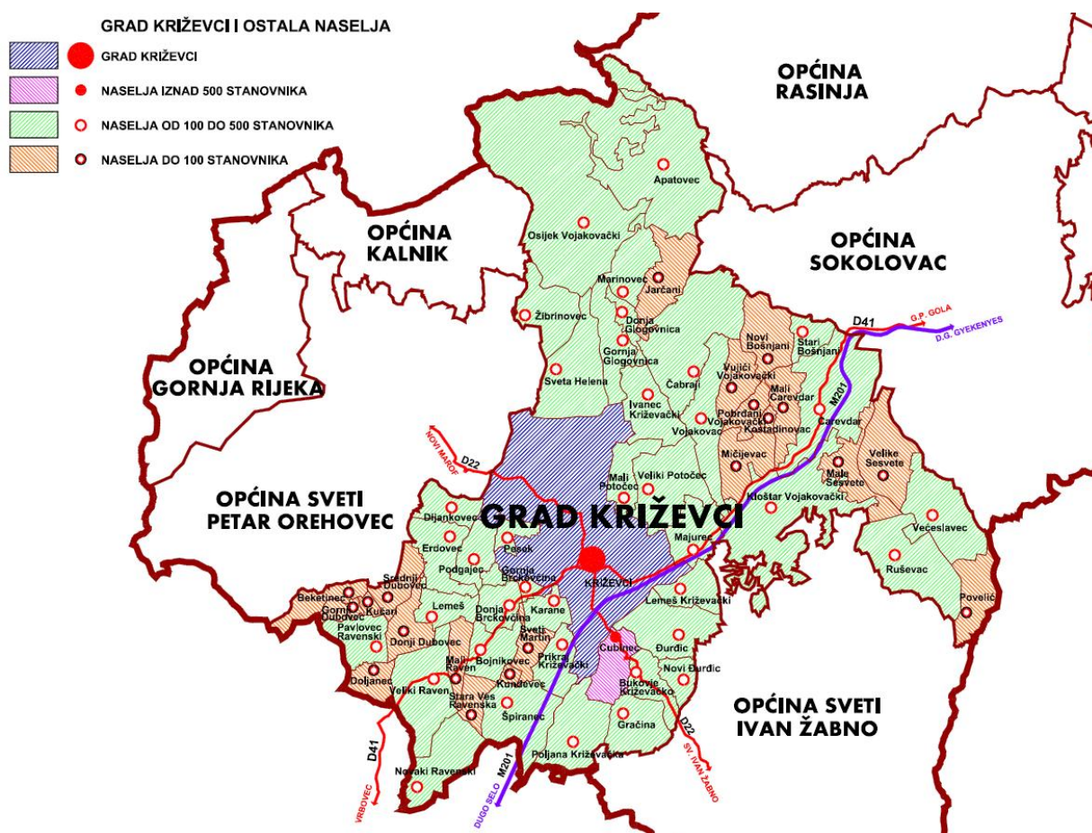
Prikaz 2 Prikaz naselja unutar JLS – Grad Križevci

Prema popisu iz 2011. udio stanovništva starijeg od 60 godina u ukupnom iznosi 23,21%, dok je prema popisu iz 1991. taj udio iznosio 20,52%.