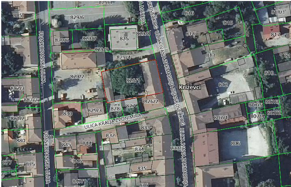
Ortofotogrametrijski snimak, preuzet s Geoportala Državne geodetske uprave, za predmetnu katastarsku česticu