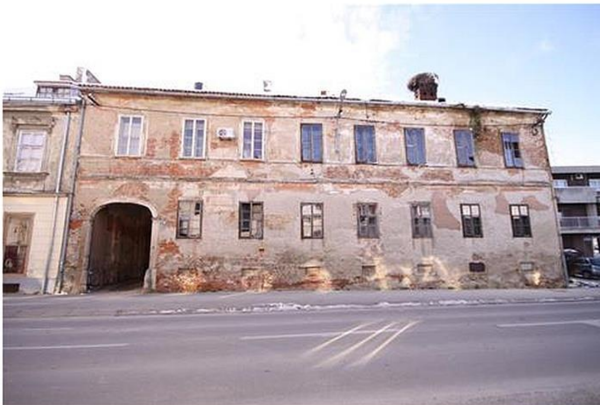
Križevci, Kuća Oštrić, I. Zakmardija 19